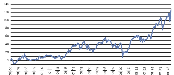
Abbildung: Performance 1 des FTC Gideon I (Klasse Ro1T, Berechnung nach ÖKB-Methode) in Prozent seit Fondsstart (16.1.2006).

Jede Veranlagung ist mit einem Risiko verbunden. Kurse können sowohl steigen als auch fallen. Beachten Sie auch die rechtlichen Hinweise sowie die Risikohinweise auf Seite 2.